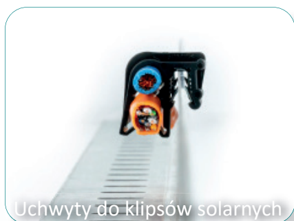
Uchwyty do klipsów solarnych