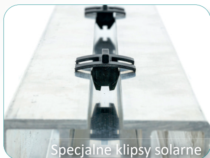
Specjalne klipsy solarne