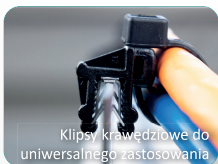
Klipsy krawędziowe do uniwersalnego zastosowania

Rozwiązania do prowadzenia wiązek kablowych w instalacjach fotowoltaicznych